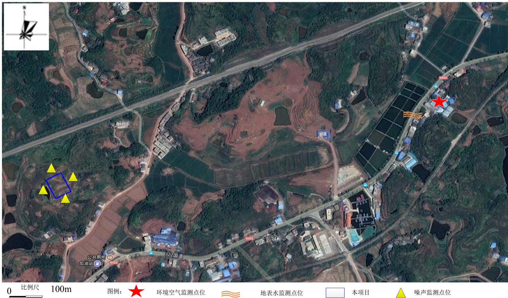
附图3 监测点位示意图